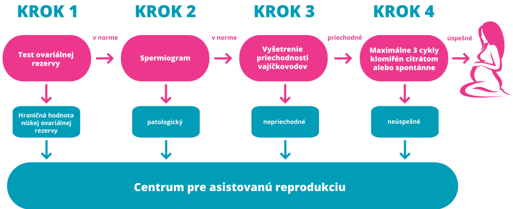
Schéma 2 Štyri kroky v diagnostike a liečbe párov s poruchami plodnosti gynekológom primárneho kontaktu

Neplodnosť je diagnostikovaná a liečená na základe 4 krokov (schéma 2)